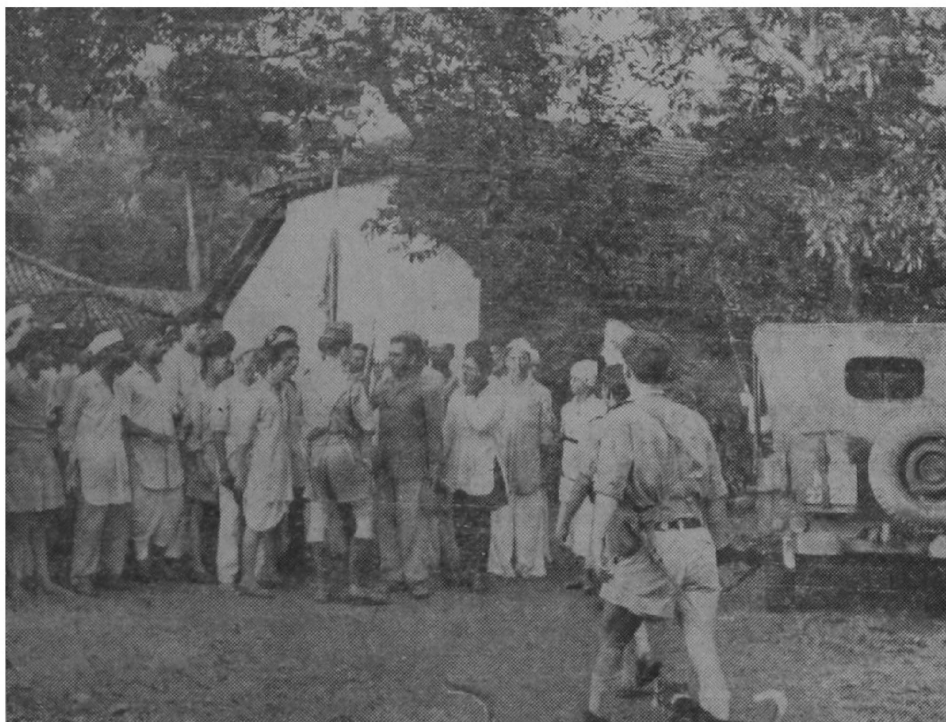
A batch of Satyagrahis accosted by the Portuguese Police in Goa.

A complicating factor is the relatively high percentage of Christians—almost all Catholics in Goa, although they probably constitute somewhat less than half of the population. Portugal alleges that the Christians want continued Portuguese rule since they fear persecution at the hands of a Hindu—Indian—State. The Pope told Mr. Nehru in July that he agreed that Goa was a political problem and not a religious one, implying that the Pope feels that the Catholics in Goa would be treated fairly under any future Indian government as the much larger number of Catholics in India today are so treated. I had an hour-long interview with the Roman Catholic Patriarch of Goa. A native of the Azores, he was a bishop in South India until 1951 and admits that the Indian