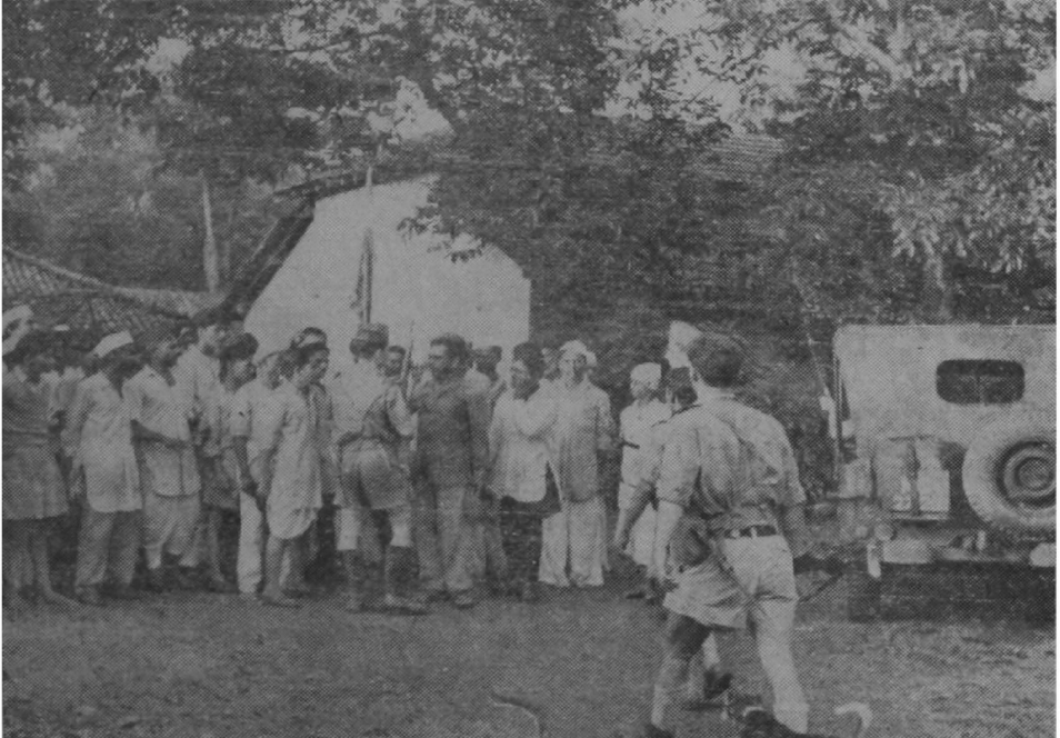
ગોવામાં પોરચુગાલ પોલીસે અટકાવેલ સત્યાગ્રહીઓની એક હુકડી

દુનીયામાં શાંતી કરાવનાર તરીકેની તેમની વધતી જતી શક્તી અરખી સમુદ્રની વિશાળતામાં અલોપ થઈ જશે. ખીજ તરફથી તેમને પોતાનો ઠોસ પક્ષ પણ હાલની નીતીથી અશાંત બનેલો છે કારણુ એક પક્ષ તરીકે તેજો સામુદાયિક સત્યાગ્રહને ઉત્સાહથી ટેકા આપ્યો નહોતો અને પરિણામ હડતાપરને અંકુશ ક્ષીણ થઈ રહેલા સમાજવાદી પક્ષ સિવાય ઉદામ પક્ષના હાથમાં જતો રહ્યો છે. હોદ ખીજા શુ પમલાં લેશે એ કહેવું મુશ્કેલ છે. પોરચુગાલ કદાચ હોદને હોંસા તરફ પરણે ખેંચી જવા માંમતું હશે કે નથી તેને શાંતિ-પ્રિય કહેવાતા હોદે તેને કાઢી મુક્યું એવા બહાના હેલળ તે હોદમાંથી નીકળી જઈ શકે. પોરચુગાલ બહુ વર્ષ આ પ્રમાણે નબી શકે એ શંકાભરેલું છે. આર્થિક રીતે ગોવા પોરચુગાલને બોલારૂપ છે પરંતુ પ્રતિબંધની દ્રષ્ટિએ તે મુડીરૂપ જણાય છે. અમેરીકા, ખીટન કે ખીજ તેના મીત્ર રાજ્યો તરફથી ગોવા ઊડવાનું પોરચુગાલ પર દબાણ થતું હોય અથવા તેને જણાવું હોય તેવું નથી લાગતું. ગોવાની સ્વતંત્રતા વિષે પોરચુગાલથી હોદ સાથે મસલતપણુ કરી શકાય તેમ નથી જાય તો તેના આર્થિકમાંના વધારે મોટાં સંરચાનોની તેના તાખાની પ્રજાઓને ખોલે દાખલો બેસે. વળી પોરચુગાલ પોતાના દેશમાં સરખુખત્યાર રાજ્ય 'હોષ તેવી ઠોષ પણ મસલતોથી ખુદ પોરચુગાલ લોકો પોતે પણ પોતાની સ્વતંત્રતા માંમતા થઈ જાય. બવિબ્ય મને તે હોય પરંતુ ઓગરટ તા. ૧૫મીના દિન કહેણુ છતાં અખાયને સમને સર્વક સાધનો વડે કરવાના માનવ પ્રયાસના એક અંતિહાસિક દિન