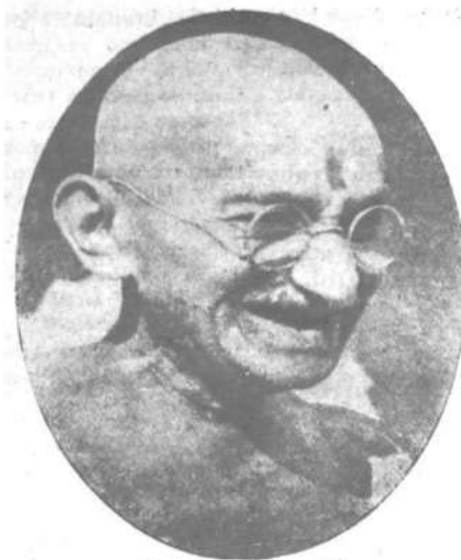
Mahatma Gandhi Mahatma Gandhi

I NDIANS throughout the world and all his Western admirers will pay homage to Mahatma Gandhi on his birthday, which falls, according to the English calendar, on Sunday, October 2, and the Hindu calendar on Wednesday, October 12. He was an apostle of truth and Non-violence. Both these are rare communities in the