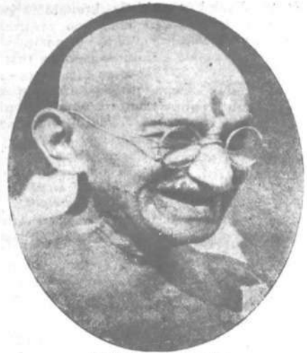
Mahatma Gandhi મહાત્મા ગાંધીજી

ઇન્ડિયન ઓપિનિઅન નેન-યુરો-પીયન એક્સિસના એક-ગ્રીનીસ્ટ્રેટોરની અમટાલી (સધન રોડેસીયા)માં મળેલી વાર્ષિક પરિષદમાં કરેલાં ભાષણમાં સેન્ટ્રલ આફ્રિકન ફેડરેશનના વડા પ્રધાન લોડ માલવરને દર્શાવેલા વિચારો સ.થે અમારી ખાત્રી છે કે સઘળા વિચારશીલ લોકો સંમત થશેજ. યુનીયન માં ખાસ કરી નેશનલીસ્ટો પાસે થી સાંભળવાને આપણે ટેવાયેલા છીએ તેના કરતાં તે તદ્દન જુદા જ હતા. નેશનલીસ્ટોની ટ્રિટિથી ભેવાને અમે ઘણેય પ્રયત્ન કરી એ છીએ પરંતુ તેઓ જે માર્ગ લઇ રહ્યા છે એ ખરો છે એમ અમને ઠસતું નથી. તેનું અંતિમ પરિણામ આ સુંદર દેશનો નાશ કરનારુંજ આવશે.