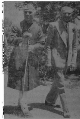
Pandit Nehru and Mr. Jinnah

On this day our first thoughts go to the architect of this freedom, the Father of our Nation, who, embodying the old spirit of India, held aloft the torch of freedom and lighted up the darkness that surrounded us. We have often been unworthy followers of his and have strayed from his message, but not only