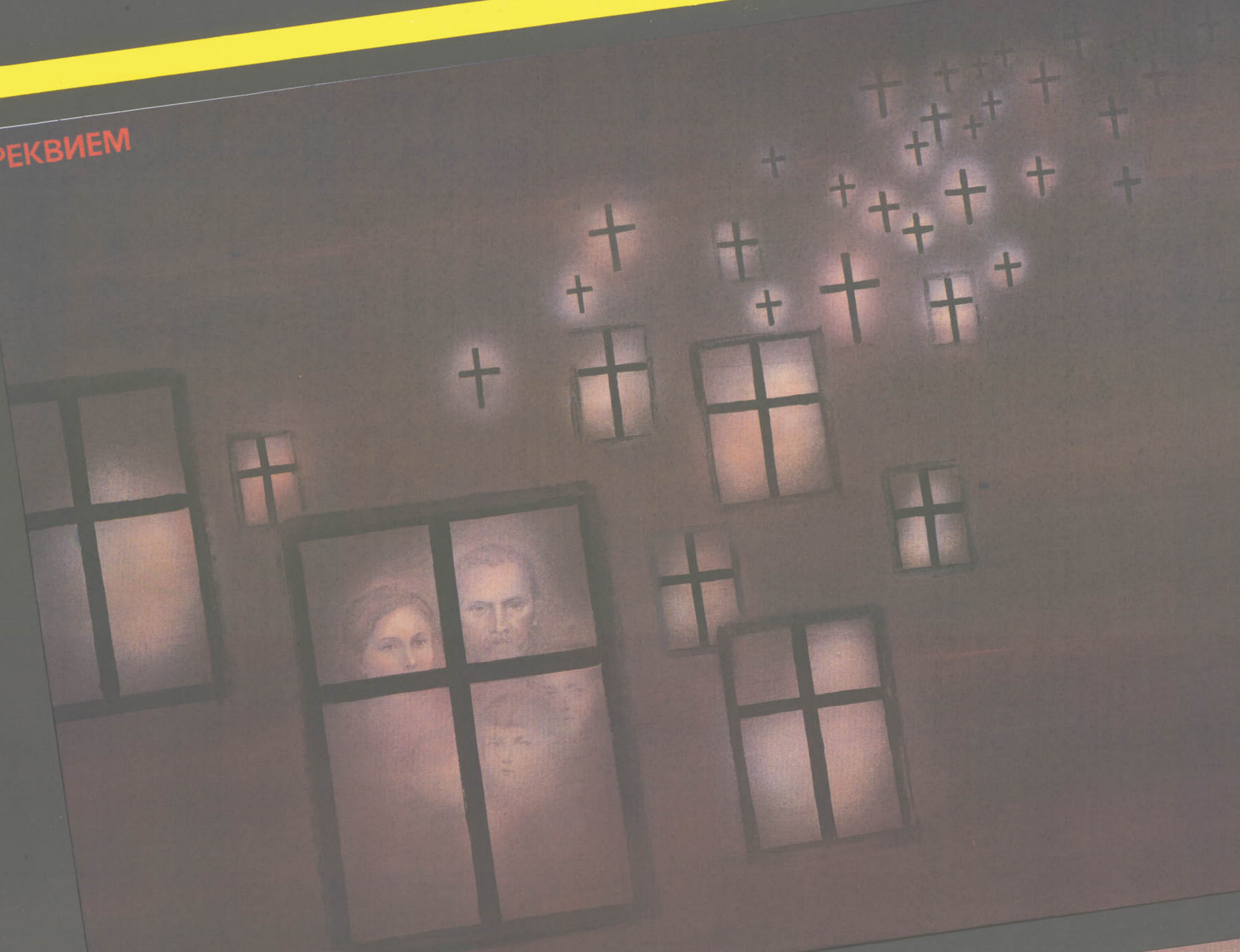
А. Лозенко. «Реквием. 1937»