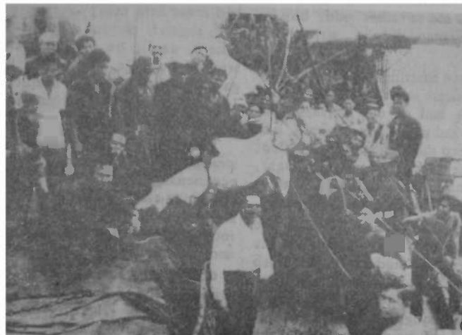
A shark caught at the sight of the crash

I asked him again whether he meant what he said. Only after his assurance I wrote down a message for my mother. I knew that she would be worried. A personal telegram from me would bring her immense joy.