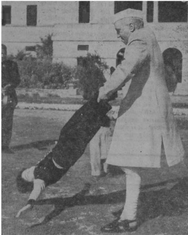
Shri Nehru at play with his grandson.

Pandit Nehru first met Gandhiji, who was later to become his Guru, about the time of the