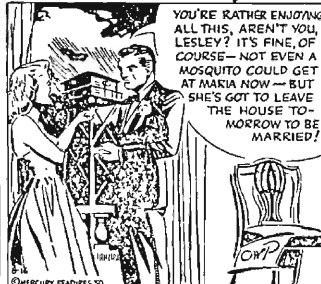
To be continued