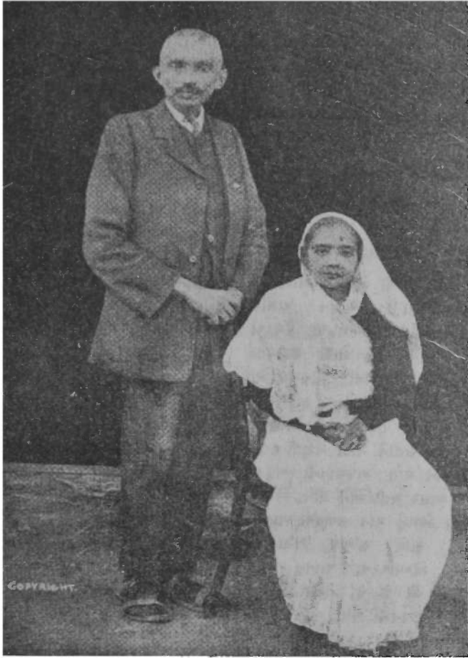
आ अने आपूण

गांधीजीं जे जिनारानी सुडी नमीन पर पग युक्त्या हे तरत न गोरा ज्युवानीयाजोनी जेक टाणीजे तेमने जालापी वीधा अने तेमना पर पश्येरां तथा सडेसां हींजो ईंक्वा लाग्या. तेजोमांनाना जेक नय तेमनी पाधडी जुंयवी वीधी.