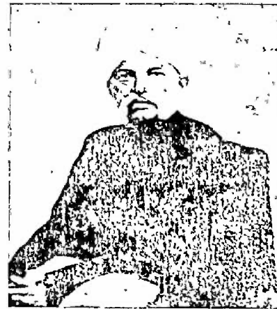
The Late Mr. Karamchand Gandhi