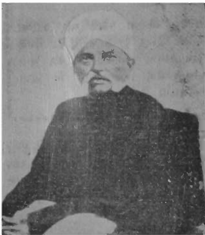
વર્ગસ્થ શ્રી કરમચંદ ગાંધી

★ લેખીકાએ આ પુસ્તક ના આરંભમાં લખ્યું છે કે: "જેમના તરફથી ગાંધીજીને માન આપવાની મને પ્રથમ પ્રેરણા મળેલી તે મારા પૂ. પિતાથી જોદન મરેયને સમર્પિત" ★