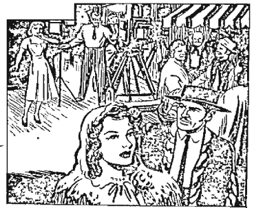
Next day while they are "shooting," Sally recognises Kroom among the film extras in a crowd scene! He is wearing Spanish costume and a black wig.