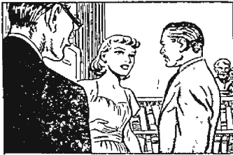
"Someone in Bedford, looking very like you, sold some pearls to a jeweller yesterday," Inspector Wilson says. "But I was here!" Sally protests.

Sally Ross, stand-in for the film star, Magda Frayne, meets again Peter Brett, camera-man. He proposes and it is accepted. She agrees to impersonate Magda when she disappears, and Peter thinks she has run out on him. Magda is found murdered—and her husband turns up demanding money from Sally whom he thinks is his wife! Because Peter's pen, is found near Magda's body, he is arrested, to Sally's horror. She is unhappy already about his coldness to her, even after she has confessed about her impersonation, and thinks he is infatuated with Carol Doe, another actress who hates Sally. Then Sally is suspected of selling Magda's jewels and things look bad for her!