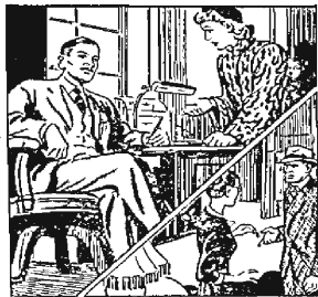
Sally goes to Inspector Wilson and tells him about Kroom borrowing Peter's pen from Lena. Meanwhile, Kroom forces Lena to hand over the key to him.