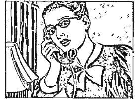
Next day, Geoff Kroom phones Lena. "I want a duplicate key to the flat," he demands. Lena dare not refuse, but protests. "She has been so good to me!" she says.