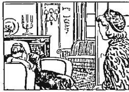
At the flat, Sally finds Lena, the secretary, in tears. "My invalid mother has to live in the country," she sobs, "and we don't have enough money!" Sally gives her money and Lena is very grateful.