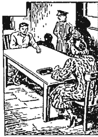
Sally, visiting Peter in gaol, asks, "What's Carol to you?" "Nothing!" he protests. "Have faith in me, Sally! I swear I'm innocent!"