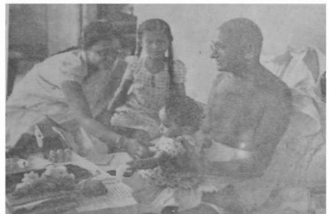
Suffer little children to come unto me.....

Gandhiji brought about many things for his countrymen in this country, and he suffered for them too. The least we can do today, is to, keep his one and only memorial, in this country alive. But it seems that even this is not to be. Perhaps in a few years, or, in another ten years. the new generation in this country would not know Gandhiji, though their forefathers had once worked side by side with the man—Gandhi—who became the Mahatma, and a Saint in the whole world. It is indeed a sad state of affairs. Are we so engrossed in our own selfish little worlds that we have no time for sentiments or that we have no value for the greater and better things in life? Gandhiji, belonged to the whole