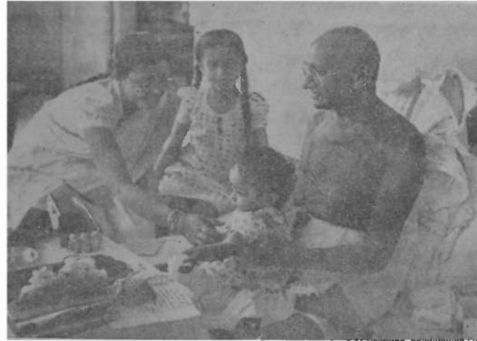
આવા એ દીવસો વહિં ગયા

થઈ રહ્યો છે. ત્યારે એ જોઈને અમને હુઃખ થાય છે કે, દક્ષિણ આફ્રિકામાં ગાંધીજી વિષે, લોકો સાવજ નિરસ થતા જાય છે અને તેમના શિક્ષણ વિશે ઉદાસી ન જનતા જાય છે. આપણામાં ના ઘણા એવો દાવો કરીએ છીએ કે આપણે ગાંધીની અહિંસાની નીતીને અપનાવી છે, તેમ છતાં આપણે એમના જીવન વિષે ઘણું ઓછું જ્ઞાન ધરાવીએ છીએ. કદાચ આપણે એમનો જન્મ યા મરણ તીથી પણ નહીં જાણતા હોઈએ અને શિક્ષણની તો વાત જ શું કરવી?