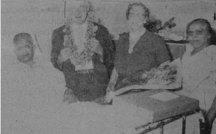
ડો. ટેયલરને શુભેચ્છા

એ ધણું જરૂરનું છે કે, હીંદીઓના લાભ માટે કે હીંદીઓ અને આફ્રિકનો વચ્ચે ખરી ગૈત્રીને સ્થાન હોય. પણ તે બનવું અશક્ય છે કે બધાં સુધી લાભની દાનતથી જ ગૈત્રી સાધવાનો આદર્શ હોય. ખર્જ નેતાં ગૈત્રી એ પાયાપર રચાવી નેષએ કે આફ્રિકન પણ શુભદોષથી બરેલો રીદીઓના નેવોજ એક માનવ છે, હીંદીઓએ એ ધ્યાનમાં રાખવું નેષએ કે કાંઈ પણ ખીલ સમૃદ્ધ સાથે લડવાને માટે તેને ઉચ્ચેરવો એ બધુંકર છે કારણુ એ બે ધારી તલવાર જેવું હથીવાર છે અને ક્યારે વાપરનારની ઉપર નેષમ આવી પડે તે એ બળુનો પણ નહીં હોય.