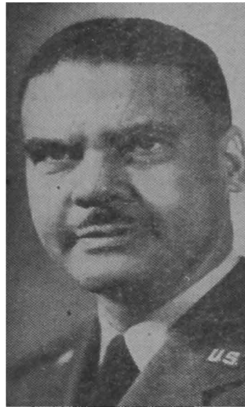
Colonel Benjamin O. Davis, Jr., recently appointed by U.S. President Dwight D. Eisenhower to be

deciding from a distance issues concerning Asia. Their insistence, however, far from solving the problems, only made them unfortunately more complicated.