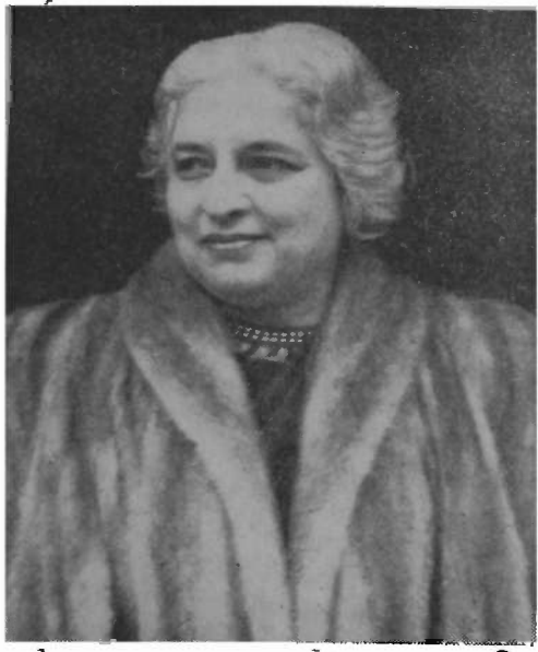
શ્રીમતી વિજ્યાલક્ષ્મી પંડીત

મંડળની હું નેતા ચુંટાઈ. બનને બાજુ થી યુનોમાં ઘણું નિર્દય રીતે બોલાયું હતું. મારા વિરોધીઓ તરફથી હાંદ અને મારા પર અપમાન જનક હુમલા થયા ત્યારે મને અપમાન લાગ્યું. અને પરીણામે હું પશુ તેજ દયીયાર