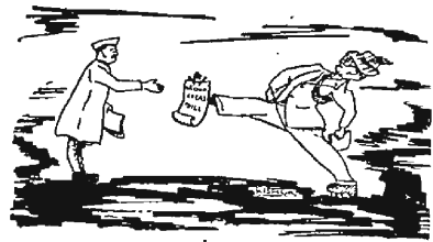
By Kishor Balsara (Original for IO)

અર્જ કોમ્યુનીસ્ટ જોખમ સાથે આફ્રિકાની સુવર્ણ નગરી, બેહાનીસબોને હમણાના વર્ષોમાં મકાન પ્રગતી કરી છે. તેનો વિસ્તાર ખુબ વધતો બ્ય છે અને તેના સુંદર ઘરો અને બાગો સાથેનાં સવેગે ખીલી રહેલાં પ્રખ્યાતો નીહાળનારને ભાગ્યેજ એમ લાગે કે આવી નગરીમાં ગરીબીને કઈ પણ સ્થાન હોઈ શકે. પરંતુ આ સમયી બહેજલાથી તો માત્ર ડેરા લોકાના એશઆરામ માટે છે. બીન-ગોરાને ઉદરમાં નાખનામાં આવ્યા છે. એક યાત્રુથી ઉભા થઈ રહેલાં કારખાનાઓ અને ખીટ ખાગુ ધરો