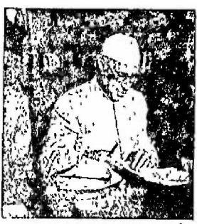
રાષ્ટ્રપિતાના આધ્યાત્મિક વારસ ના હસ્તે રાષ્ટ્રપિતાના ઇતિહાસ પ્રતિષ્ઠા નમકે સત્યાગ્રહનું સ્મારક રચાયું હતું.

મહાત્માજીને દુર્બળ પ્રબળ સખ્યા કરવી હતી, આચારીન પ્રબળમાં તુલન કરવી હતી, આચારીન પ્રબળમાં તુલન આશાનો સંચાર કરવો હતો અને