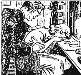
Bailey finds Sally crying and tries to comfort her. She tells him about her love for Peter, and how she has had to let him think she ran out on him, in her guise as Magda.