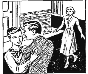
In a corridor, on her way to her dressing-room, Sally sees Carol Doe with her arms about Peter! It seems like a love scene.