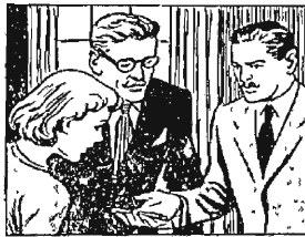
"I've never seen that pen before," Bailey tells the inspector, "Neither have I!" Sally says. "Has she sounded convincing? She must shield Peter!"

Sally Ross, is engaged by John Bailey, a film director, as a stand-in for the star, Magda Frayne. She meets again Peter Brett, camera-man, who loves her, proposes, and is accepted. Sally then takes the star's place as she is missing. Peter, meanwhile, thinks Sally has run out on him. A man enters Sally's room, — It is Magda's, husband, Geoff Kroom! He takes money and vanishes. Then word comes that Magda has been found murdered! The make-up man reports a blonde wig is missing, and Carol Doe, the actress who wants Peter, says she saw Magda with it. Carol is seen dancing with Geoff Kroom who disappears, Carol saying she does not know him. Then Geoff Kroom threatens Sally again! Sally confesses everything to Peter but he is unforgiving. Then, to her horror, Sally recognises a fountain-pen found near Magda's body, by the police — It is Peter's!